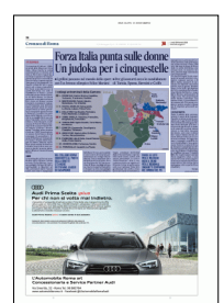
Peso: 1-3%, 4-41%